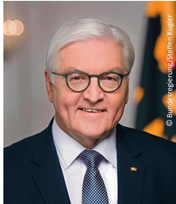
Bundespräsident Frank-Walter Steinmeier hat die Schirmherrschaft übernommen

Im Rahmen seines Profils als Europaschule wird das Burgau-Gymnasium mehrere Themenschwerpunkte zu den Bereichen „Rassismus“ und „europafeindliche Nationalismen“ ins Programm aufnehmen, unter Mitwirkung von Integrations- und Antisemitismusbeauftragten.