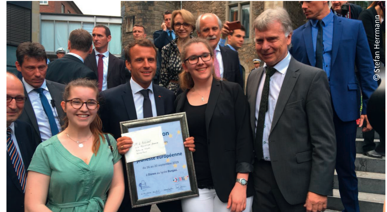
Präsident Macron mit Schülerinnen des Burgau-Gymnasiums und dem Schulleiter, nach der Übergabe der Einladung beim Karlspreis-Fest

Die Abschlussveranstaltung mit ca. 2000 Jugendlichen und Erwachsenen findet als Festakt am 20.09.2019 um 18:00 Uhr in der Arena Kreis Düren statt, mit Präsentationen aus den Workshops und anschließender Party für Jung und Alt.